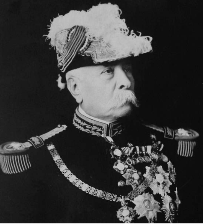
İleri yaşlarında Porfirio Díaz

Bu, Meksika tarihinde eşi görülmemiş bir dönüşümdü: Ülke gittikçe ve hızla kuzey Atlantik kapitalist dünyasıyla bütünleşiyordu. Bu sırada Meksika'nın en güçlü toprak sahipleri ve iş adamları, kurduğu rejimle gelen siyasi istikrar ve iktisadi gelişme nedeniyle Díaz'a son derece minnettardı. Basitçe özetleyecek olursak, Díaz yönetimi sayesinde daha önce benzeri görülmemiş ölçekte bir servet edinmiş ve daha önemlisi, bunu ellerinde tutabilmişlerdi. Aralık 1905'te, Devrimin patlak vermesinden beş yıl önce, Meksika'nın uysal Meclisi, şaşaalı bir tören eşliğinde diktatöre değerli taşlarla kaplı bir madalya sunmuştu. Üstünde "Ulusu Barışa Kavuşturan ve Birleştiren" yazıyordu. 6