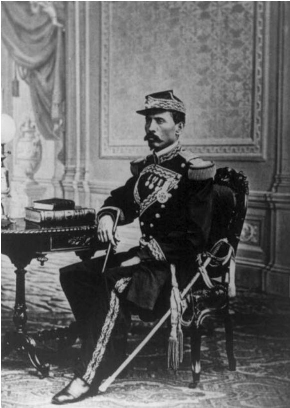
Genç Porfirio Díaz

bir madencilik merkezine dönüştü. Artan ticaret hacmi sayesinde Meksika'da dolaşımda olan toplam para, 1880 ve 1910 arasındaki otuz yılda 12 kat artarak 25 milyon pezodan 300 milyonun üstüne çıktı. 1895'e gelindiğinde Meksika hükümeti ilk kez bütçe fazlası vermişti. Yabancı yatırım da şahlandı; en büyük yatırımcılar ABD (madencilik ve demiryolu), Brezilya (petrol) ve Fransa (bankalar) olmak üzere, 1884'te 110 milyon pezodan 1911'de 3,4 milyar pezoya çıktı. 1911'de Meksika yıllık 14 milyon varille dünyanın üçüncü en büyük petrol üreticisi haline gelmişti. 5