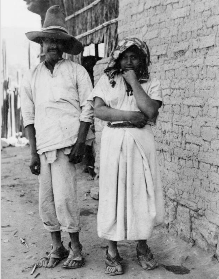
Meksikalı peón (çiftlik yanaşması) bir çift

kilise bulundurur ve büyük bir lütufla, burada yapılan vaftiz ve evliliklerin giderini öderdi. Çok sadık bir yanaşmanın çocuğuna vaftiz babası olmayı bile kabul edebilirdi. Yanaşmaların çoğu zaman erken öldüğü bu çiftliklerde, hiç olmazsa cenazelerinin saygın biçimde kaldırıldığı bir de mezarlık olurdu.