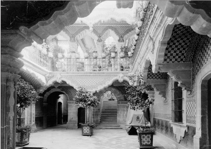
Zengin bir çiftlik malikânesinin içi

Yanaşmaların yaşamı rahat olmaktan çok uzaktı, ama toprak ağasının koruması altında kalırlarsa en azından ailelerinin görece güvende olduğu varsayılırdı. Bu yüzden en zor ve bağımlı durumdaki yanaşmaların efendilerine başkaldırması pek olası değildi. Bununla birlikte Porfiriato döneminde kâr olanakları artıp hacienda 'lar yeni yatırımcılar tarafından devralındıkça, eski babacan uygulamalar da genellikle ya azalmış ya da ortadan kalkmıştı. Sözgelimi Durango'daki büyük bir çiftlik, paradan tasarruf etmek için önce her yıl yerel bir köy festivaline boğa vermeyi durdurmuş, sonra da köyün kilisesine sağladığı mumlara bile son vermişti. Bu tür değişiklikler, toprak ağalarının çiftlik ahalisi ve köy campesino 'ları arasındaki itibarının zedelenmesine neden olmuştu. 24