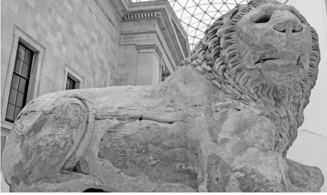
Knidos Arslanı, British Museum, MÖ 2. yy.