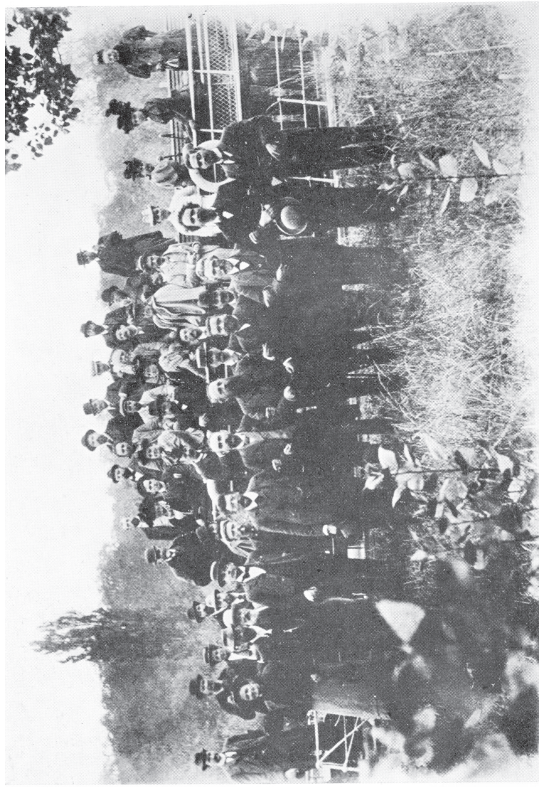
Sosyalist Enternasyonal Londra Kongresi (1896)

İlk sırada soldan sağa: Victor Adler, Gyorgi Plehanov, Henry Hyndman, Jean Jaurès, August Bebel, Enrico Ferri.